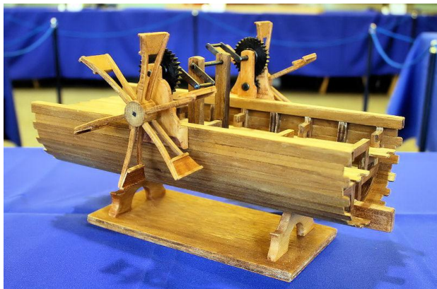
Barca a manovelle